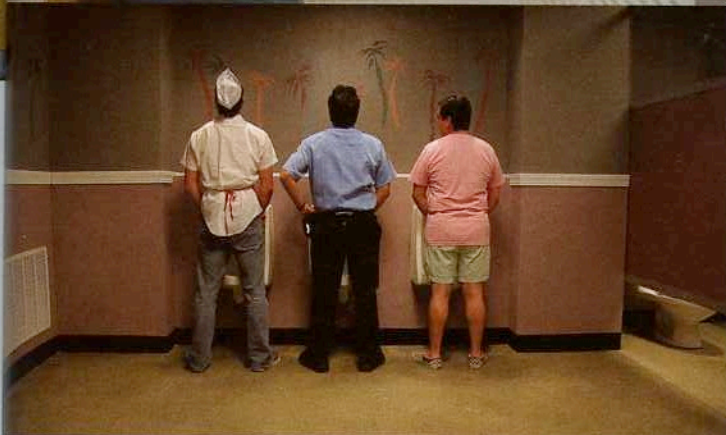
Fourplay: Tampa, de Kyle Henry.