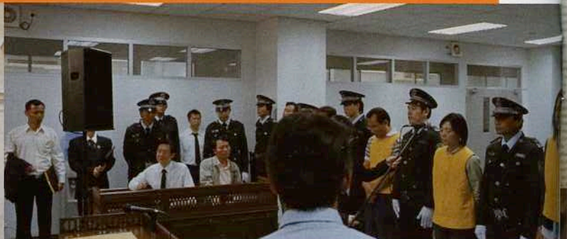
Killing the Chickens to Scare the Monkey, de Jens Assur.