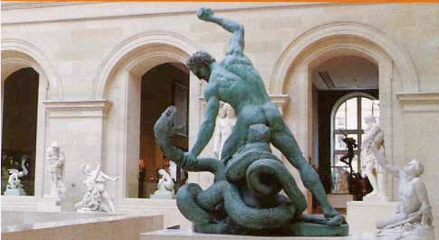
Le songe de Poliphile, de Camille Henrot.

Si nos coups de cœur furent assez rares, la programmation de la Quinzaine des réalisateurs a, cette année, fait preuve d'un éclectisme délectable. Tour d'horizon.